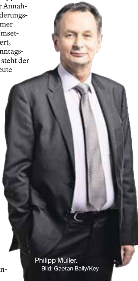
Philipp Müller.

Geht es in der Schweiz um das Thema Zuwanderung, führt kein Weg an Philipp Müller vorbei. Seit der Annahme der Masseneinwanderungsinitiative hat er sich immer wieder zu möglichen Umsetzungsvarianten geäussert, vorzugsweise in der Sonntagspresse. Im Mittelpunkt steht der FDP-Ständerat auch heute Mittwoch, wenn die Kleine Kammer über die Zuwanderungsfrage debattiert. Müller will die vom Nationalrat vorgeschlagene Stellenmeldepflicht ausbauen: In Berufsgruppen mit hoher Arbeitslosigkeit sollen Firmen inländische Stellensuchende zu einem Gespräch einladen und Nichtanstellungen begründen müssen. Das Modell orientiert sich an der Praxis des Kantons Genf und wurde im Bundeshaus von mehreren Parlamentariern herungereicht.